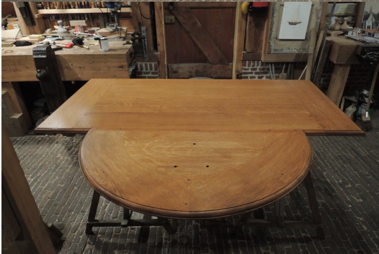
1665 mm breed