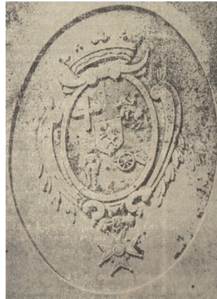
Wapen van de Franse De Ruyters [op een grafzerk in La Valette-du-Var]

Drie kwadranten komen overeen; beide wapens hebben een leeuw op het hartschild.