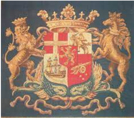
Wapen van Engel de Ruyter [op diens sloepkussen]