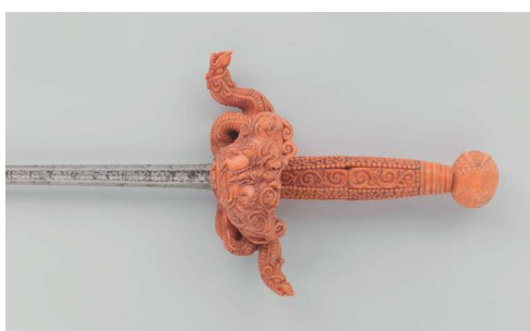
Degen met vierkantige kling en sierlijk gevest van bloedkoraal met zwartleren schede met koperen punt en riemhaak, eveneens van bloedkoraal. Aan de Ruyter op 13 januari 1676 te Napels geschonken door de vicekoning van Sicilië (collectie Rijksmuseum, NG-NM-10403).