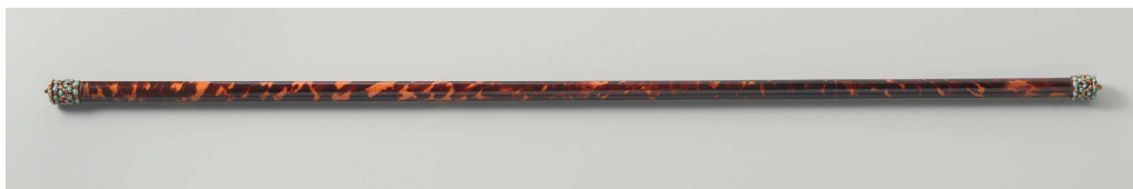
Commandostok bedekt met een laag schildpad met verguld koperen knoppen, ingelegd met turkooizen en diamantjes. Aan de Ruyter op 13 januari 1676 te Napels geschonken door de vicekoning van Sicilië (collectie Rijksmuseum, NG-NM-10402).