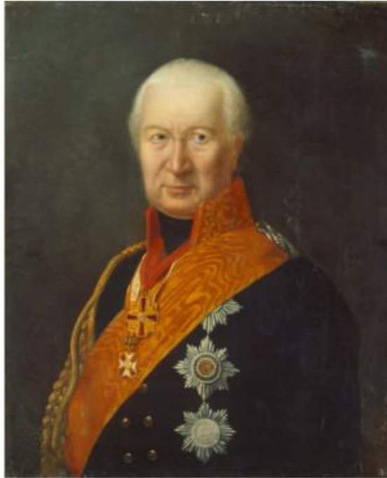
Generaal Graaf Von Kalckreuth

Bondt, advocaat in Amsterdam. Kalckreuth slaat er zijn kwartier op. Bondt is al snel op de hoogte en schrijft op 10 oktober 1787 een in het Frans gestelde 'welkomstbrief' aan de generaal: