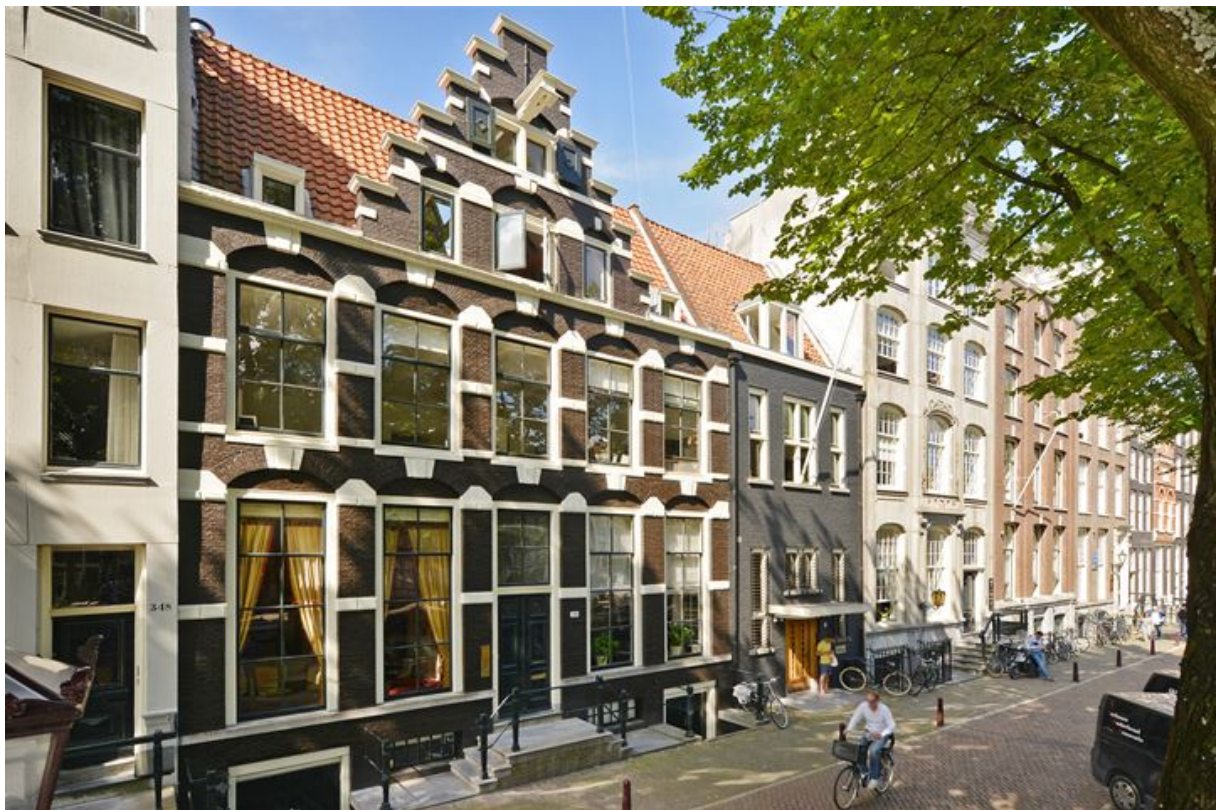
Herengracht 346. Een groot pand, dat nu acht beladressen herbergt.