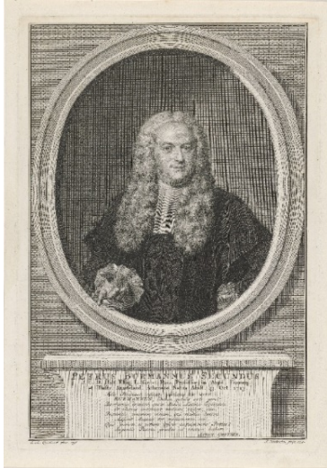
Pieter Burmannes secundus Rijksstudio.Ilius

onveranderlyke Santhorstsche geloofsbelydenis (1772). Een bij wijle gehoord verwijt over de bijeenkomsten was het vroom rooms vozen met dertien relieken. Een typisch oordeel van buitenstaanders. In feite is het een rijk gestoffeerde Santhorster visie op het 'voorouderlijke' streven naar een open maatschappij, waar rechten en plichten van alle burgers min of meer democratisch worden vastgelegd (napje van Brederode).