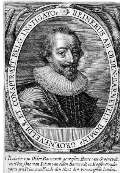
Reinier van Oldenbarnevelt