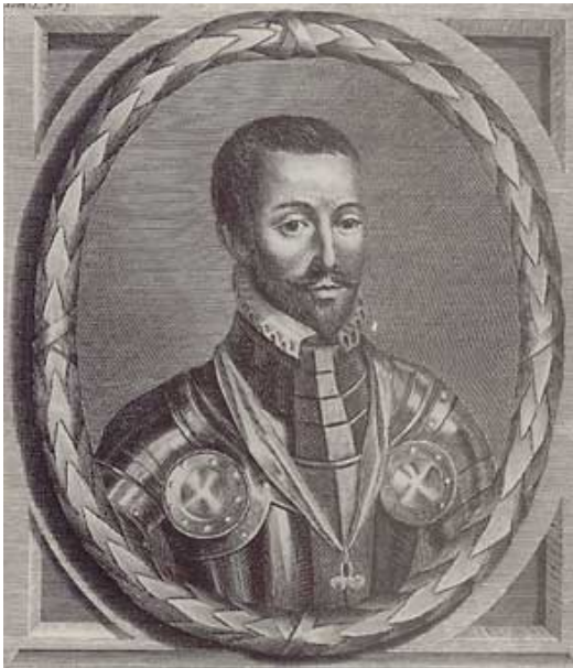
Hendrik van Brederode 'de grote Geus'

Die andere schoen was zeker zoekgeraakt. Maar deze verwijst naar de kwajongensstreek op de torenspits van Vlissingen. 6 Een Michieltje van tien stapt met zijn blauw geruite kieltje de bouwplaats van de toren op. Die werd destijds niet gehekt. 'Dat durf je niet!' 'Oh nee?' en hij klimt langs de ladders omhoog. De arbeiders vinden het genoeg, willen naar huis en halen de ladders weg. Veel te gevaarlijk met die jonge gasten in de buurt. Maar wie zit er nog boven bij de spits? Michieltje in zijn wapperende kieltje. 'Kom als de bliksem naar beneden!' 'Hoe dan?' Goede raad is duur, maar niet voor ons eigenwijze handige Chieltje. Hij trapt met zijn hielen wat leien stuk en komt 'met behulp zyner gezwinde leden, armen en benen, weer gelukkig beneden'. Waarom met een schoen deze anekdote vermelden? Omdat hij het kunststukje 'in zijn mannelijke jaren' herhaalde en 'langs de trappen van alle scheepsdiensten, en alle de gevaarlykheden der zee en der vyanden, tot de hoogste zeeampten zoude opklimmen'. 6 Dat dus. Een tastbaar symbool dat het ongenoegen met de Oranjes duidelijk maakte: Niet een Oranje heeft ons door de perikelen van de Engelse zeeoorlogen gevoerd. Niks geen adel, maar een gewone jongen uit het Zeeuwse volk, die de mouwen opstroopte. Respect!