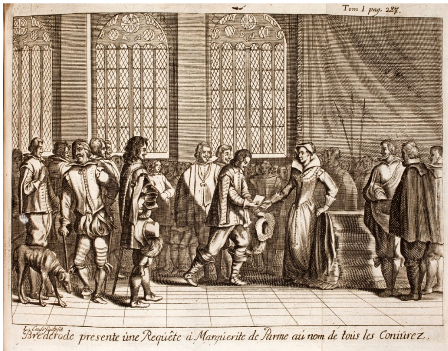
Hendrik van Brederode biedt in 1566 het smeekschrift aan, geschreven door Jan van Marnix, broer van Marnix van St. Aldegonde.

'Hendrik van Brederode (bijgenaamd 'de Grote Geus'), de oudste zoon van Reinoud III, was mede-indiener van het beroemde smeekschrift der edelen aan Margaretha van Parma in 1566, en daarmee een van de grondleggers van de Opstand. Hij ging door voor een vooraanstaande graaf van Holland, liet eigen munten slaan tijdens de troebelen -uiteraard zonder barensteel- was voorman bij de Beeldenstorm en commandant van zijn eigen leger (maar ook alcoholist).'