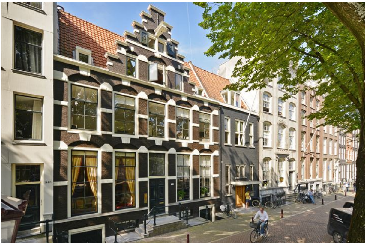
Herengracht 346. Een groot pand, dat nu acht beladressen herbergt.