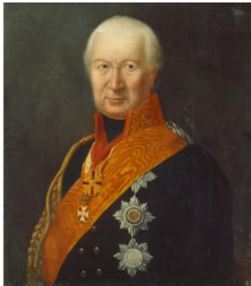
Generaal Graaf Von Kalckreuth