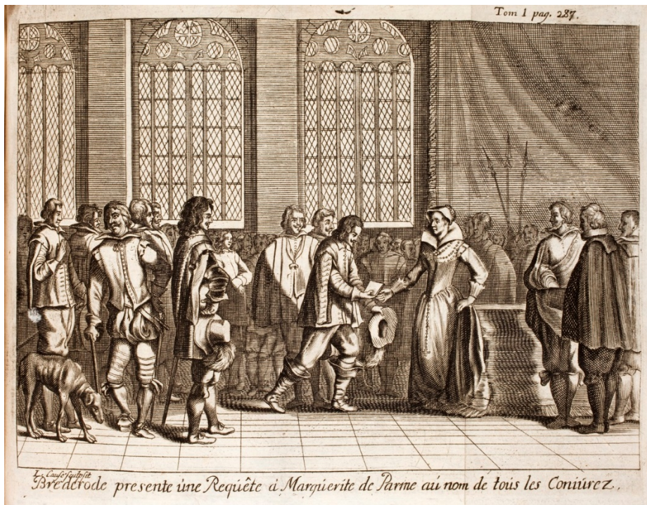
Hendrik van Brederode biedt in 1566 het smeekschrift aan, geschreven door Jan van Marnix, broer van Marnix van St. Aldegonde.

'Hendrik van Brederode (bijgenaamd 'de Grote Geus'), de oudste zoon van Reinoud III, was mede-indiener van het beroemde smeekschrift der edelen aan Margaretha van Parma in 1566, en daarmee een van de grondleggers van de Opstand. Hij ging door voor een vooraanstaande graaf van Holland, liet eigen munten slaan tijdens de troebelen -uiteraard zonder barensteel- was voorman bij de Beeldenstorm en commandant van zijn eigen leger (maar ook alcoholist).'