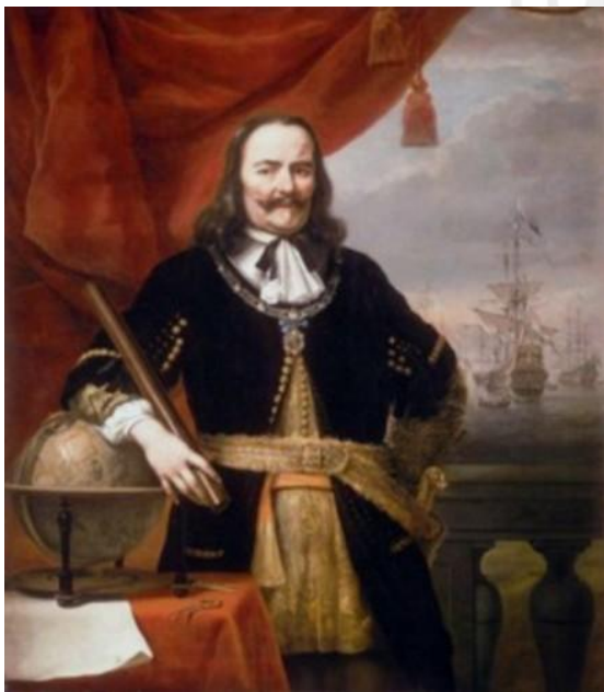
Ferdinand Bol schilderij 1667

Misschien wel het bekendste portret van Michiel de Ruyter is dat van Ferdinand Bol uit 1667