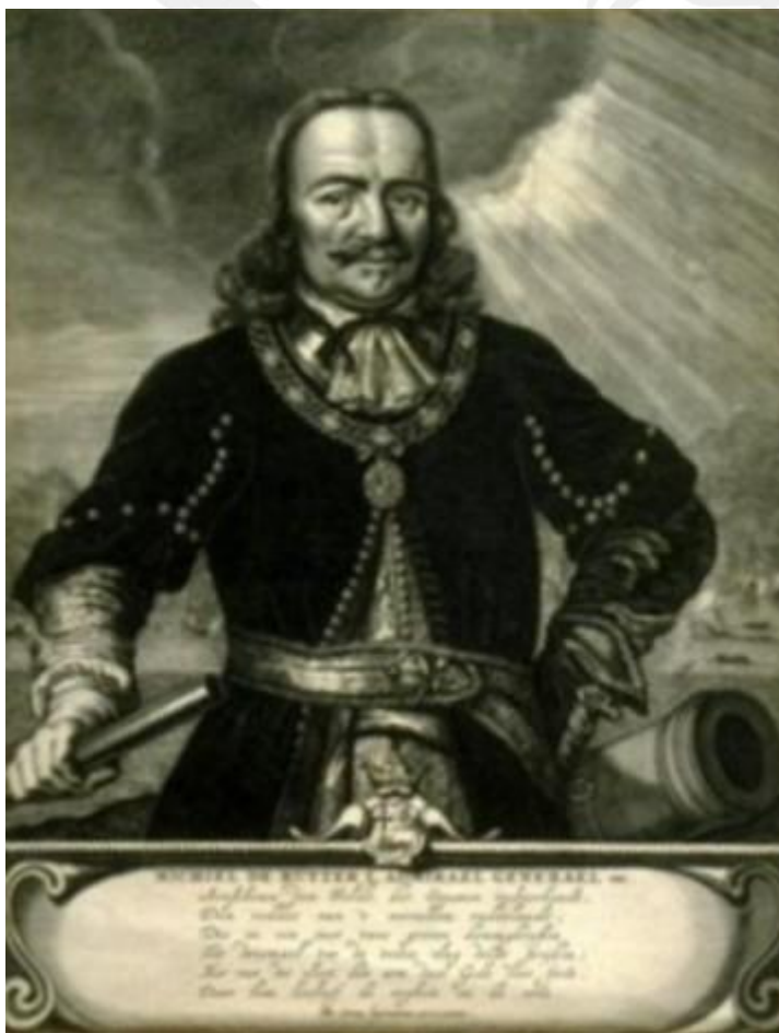
Gravure door Hendrik de Bary 1673. naar het schilderij van F. Bol.

Een van de vele kopieën die van dit schilderij gemaakt zijn is die van Hendrik Bary.