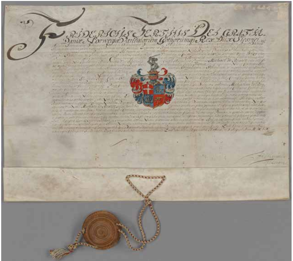
Deense adelsbrief Michiel de Ruyter 1660, archief Michiel Adriaensz. de Ruyter, nummer toegang 1.10.72, inv. 170B.

Eerder, op 1 augustus 1660, was Michiel Adriaenszoon de Ruyter door Frederik III, Koning van Denemarken, in de Deense adelstand verheven. In het Deense adelsdiploma staat vermeld 'In ordinum nobilium equestrium' waaruit sommigen hebben afgeleid, dat hij de Deense titel van ridder had verkregen. Volgens mededeling van het Dansk Adels Forening was aan Michiel de Ruyter evenwel geen titel toegekend. Wel verkreeg hij een Deens familiewapen. Dit wapen vertoont achtereenvolgens een geharnaste ruiter met paard met een zwaard in zijn rechterhand, in rood een zilveren kruis, een oorlogsschip met volle zeilen en een kanon met kogels. Letterlijk betekent dit: 'De Ruyter heeft het Deense rijk geholpen ter zee en te