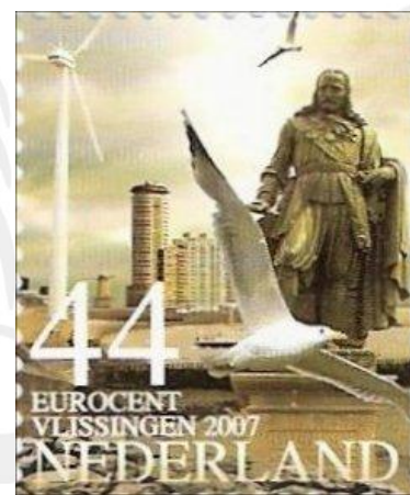
Het standbeeld op de boulevard te Vlissingen.

Ook naar aanleiding van de samenstelling van de " Canon van Nederland " met daarin de accenten die het fundament voor het Nederlandse historische erfgoed vormen, komt de Ruyter prominent voor.