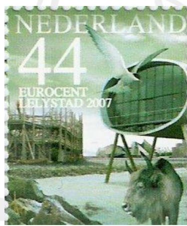
Het vlaggenschip "De Zeven Provinciën" in aanbouw te Lelystad